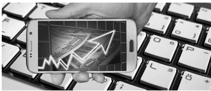
O valor médio nas transações do semestre foi de R$ 28,9 mil por veículo arrematado.

Segundo dados da AutoAvaliar, plataforma líder no Brasil de comercialização de veículos seminovos entre concessionárias e lojistas, de janeiro a junho, as revendedoras repassaram, via prego online, cerca de 48 mil veículos usados ao varejo multimarca no País, ante as 27,9 mil unidades vendidas no exercício anterior. O valor médio nas transações do semestre foi de R$ 28,9 mil por veículo arrematado.